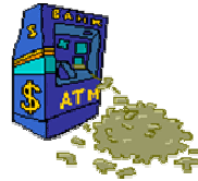
Erfolg / Geld

Mond : 1.5 Mars : 0 Merkur : 3 Jupiter : 1 Venus : 1 Saturn : 0 Sonne : 2