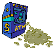
Erfolg / Geld

Mond : 0 Mars : 1 Merkur : 4.5 Jupiter : 1 Venus : 0 Saturn : 0 Sonne : 2