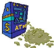
Erfolg / Geld

Mond : 1 Mars : 1.5 Merkur : 3 Jupiter : 1 Venus : 0 Saturn : 1 Sonne : 1