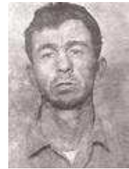
45) Donald „Pee Wee“ Gaskins