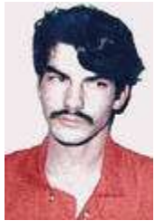
35) Westley Allan Dodd