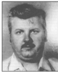
43) John Wayne Gacy