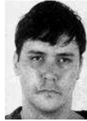
62)Edmund Emil Kemper III