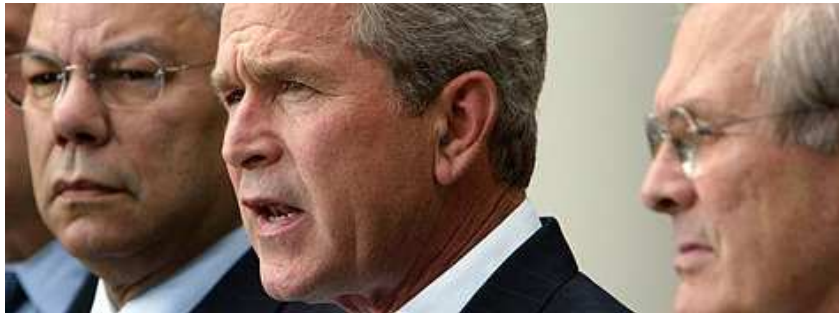
Colin Powell, George W. Bush und Donald Rumsfeld Studie: US-Regierung hat 935 Mal gelogen

Mit einem fiktiven Verdacht, den man jeder Person anhängen kann ohne sich rechtfertigen zu müssen, ist es nun den kriminellen Elementen des Staates möglich, jeden Bürger, der in irgendeiner Weise unangenehm auffällt – einzusperren und nach Guantanamo zu verschleppen oder sonst irgendwie mundtot zu machen.. .