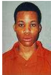
67)Lee Boyd Malvo