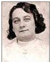
50) Anna Maria Hahn