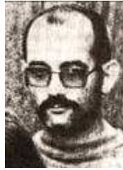
61)Patrick Wayne Kearney