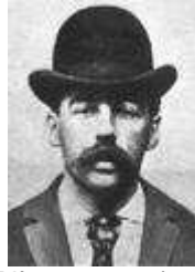
56)Herman Webster Mudgett