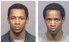
68)John Allen Muhammed