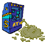
Erfolg / Geld

Mond : 1 Mars : 1.5 Merkur : 0 Jupiter : 2.5 Venus : 0.5 Saturn : 2.5 Sonne : 1