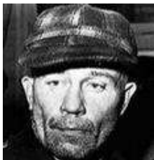
46) Ed Gein