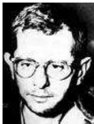
47) Harvey Murray Glatman