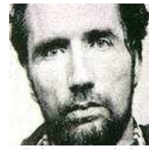
53) Gary Heidnik