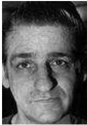
34) Albert DeSalvo