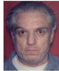
41) Gerald Gallego